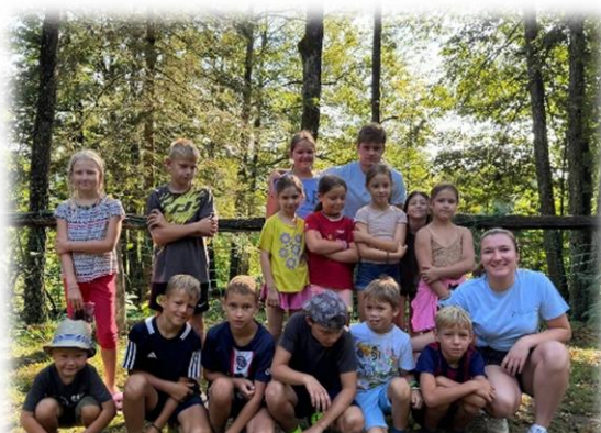
4. skupina: Bogati imenitneži