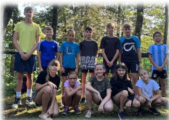
5. skupina: Imenitni iglavci