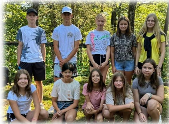
6. skupina: Izgubljeni Italijani